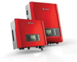
Serie DT Doble-MPPT, Trifásico 10kW/12kW/15kW/17kW/20kW/25kW